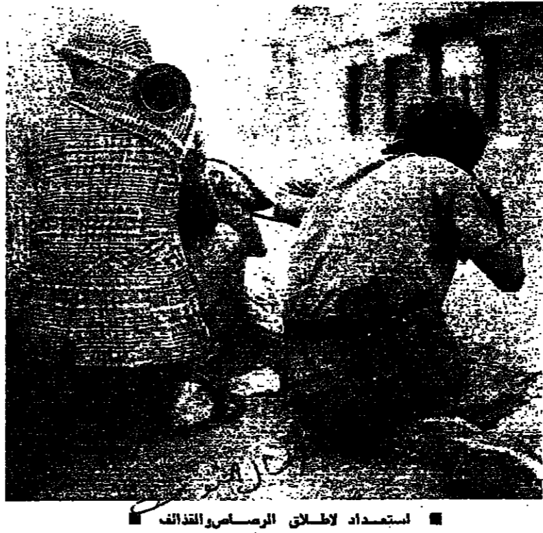
استعداد لاطلاق الرصاص والذخائر